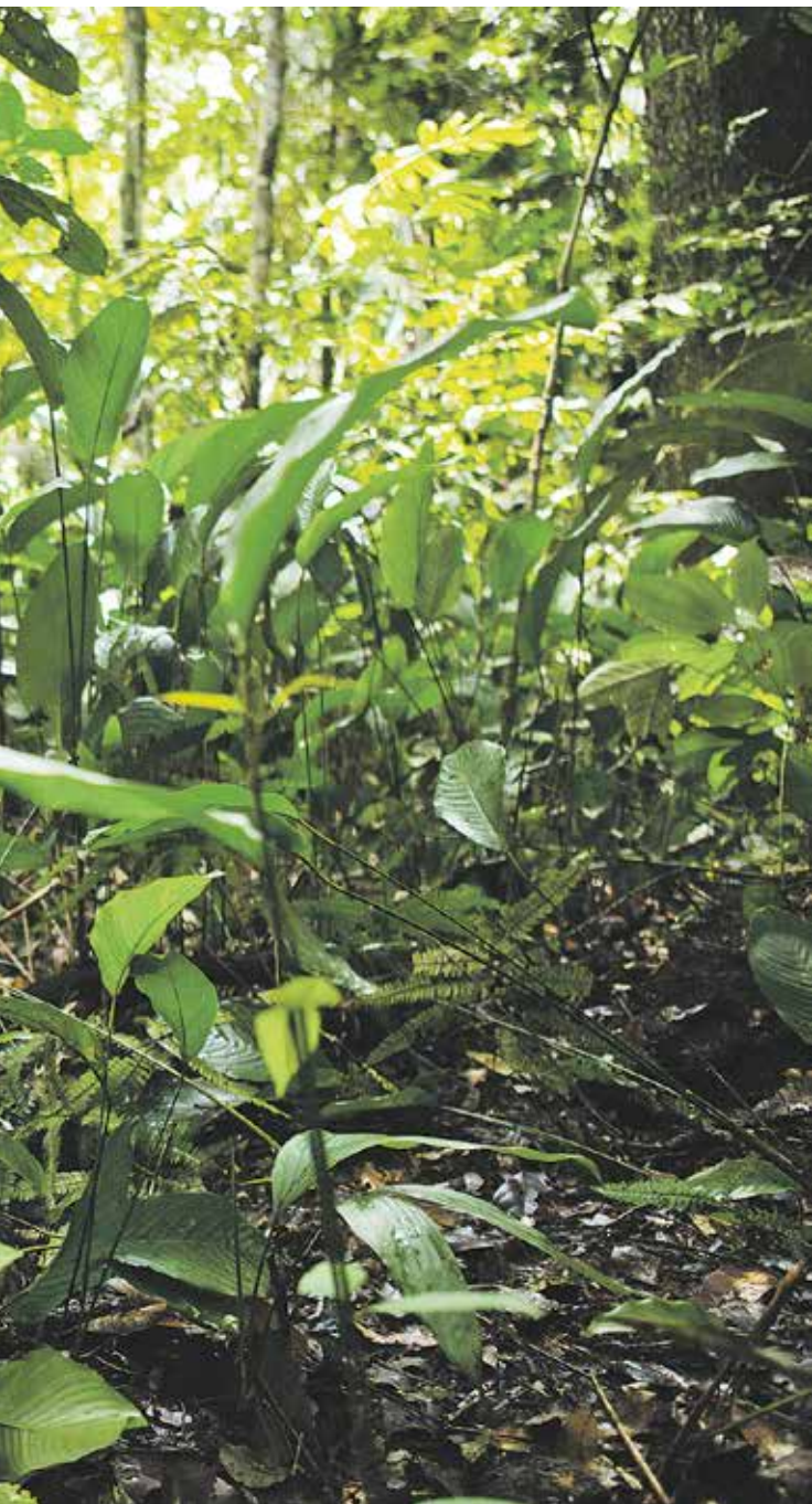
Mit gerade mal zwölf Jahren hilft Gumer-sindo bei der Paranussernte