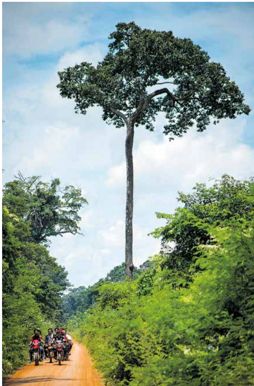
Der Paranussbaum wächst nur in der wilden Natur